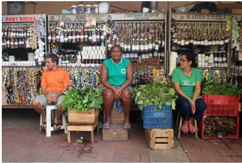
FIGURA 3: Vendedoras de ervas do Ver-o-Peso

A cultura tradicional e popular é o conjunto de criações que emanam de uma comunidade cultural fundada na tradição, expressadas por um grupo ou por indivíduos e que, reconhecidamente, respondem às expectativas da comunidade enquanto expressão de sua identidade cultural e social, as regras e os valores se transmitem oralmente, por imitação ou de outras maneiras. Suas formas compreendem, entre outras, a literatura, a música, a dança, os jogos, a mitologia, os rituais, os costumes, o artesanato, a arquitetura e outras artes. (UNESCO, 1989).