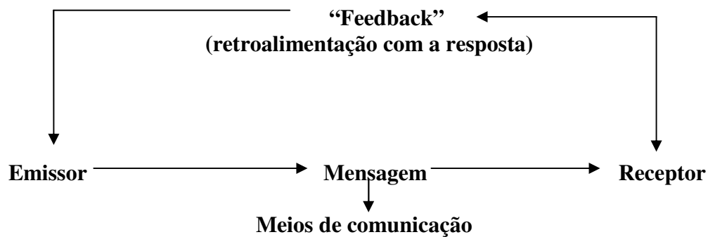
FIGURA 4: Esquema de comunicação Fonte: Montejano, 2001.

A função da publicidade dentro do marketing é fazer com que se conheçam os produtos e serviços turísticos, difundir uma imagem de marca ou a imagem da empresa, diferenciando-a dos da concorrência para que o receptor da mensagem possa identificá-los. (MONTEJANO, 2001).